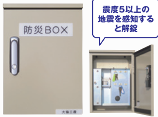
防災BOX (特許番号: 特許第5991621号)

無電源なのに震度5以上の揺れを感知。電気工事不用でロック解除ができるため、避難タワーの入口や避難場所侵入口の鍵を自動開錠することができます。避難管理者がその場になくても避難できる体制づくりの必需品です。