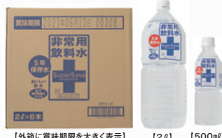
【外箱に賞味期限を大きく表示】 [2L] [500ml]

用途に合わせて500mlと2Lの2種類を用意。加熱殺菌処理で5年保存を可能にしました。軟水(硬度28mg/ℓ)に仕上がっていますので、赤ちゃんのミルク用や、お薬を飲む際にも安心です。外箱に賞味期限を大きく表示。室戸海洋深層水のミネラルが凝縮されています。